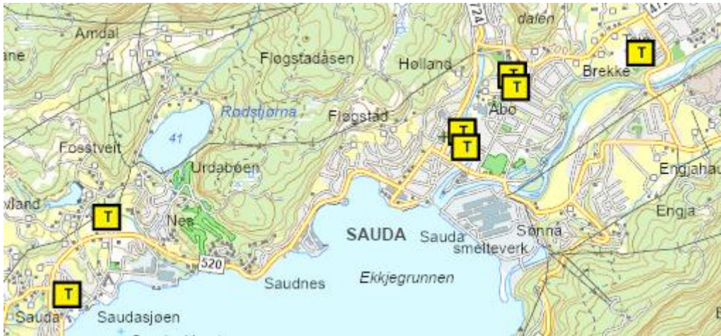
الملاجئ العامة في ساودا

أما الملاجئ الخاصة، فهي مخصصة لعدد الأشخاص الموجودين في المبنى أو العقار، وهي مخصصة للأشخاص الذين يتواجدون عادةً في هذا المكان.