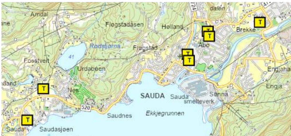
Громадські укриття в Sauda

Приватні укриття розраховані на кількість людей, які перебувають у будівлі або на об'єкті. Вони призначені для тих, хто зазвичай перебуває на цій території або в цій будівлі.