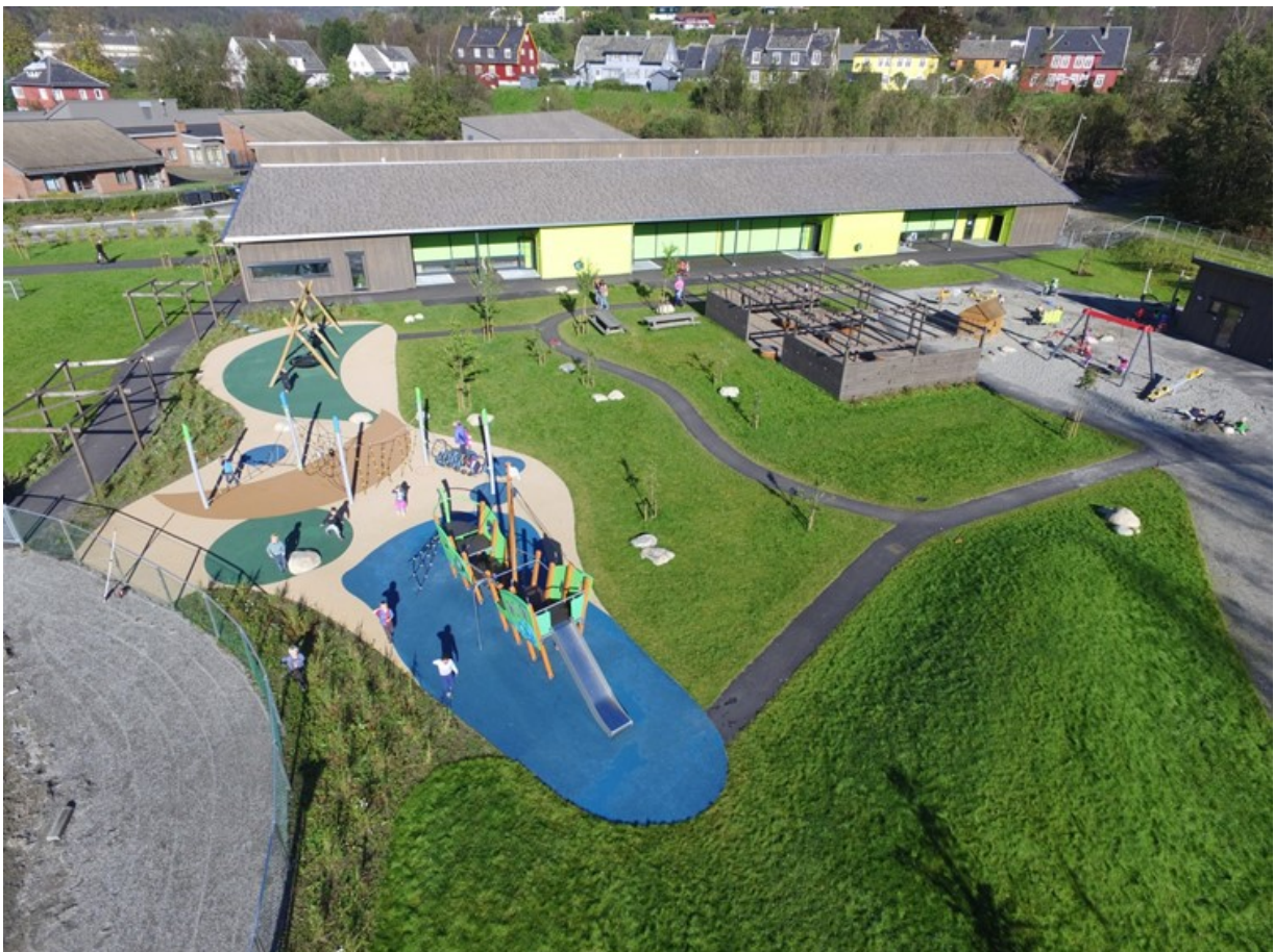
Dronebilde av nye Veslefrikk barnehage