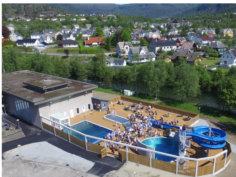
Utebadeanlegget opna i 2016